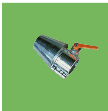
Cono de centrado.