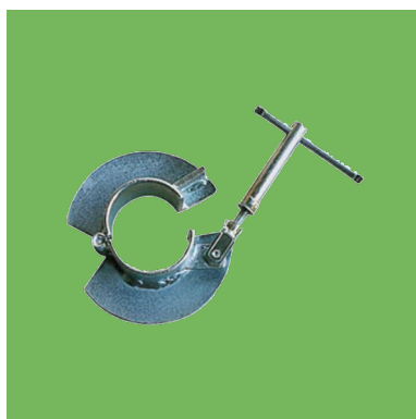
Abrazadera de acero galvanizado.