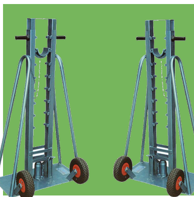
Caballote alzabobinas hidráulico con bomba de pedal.